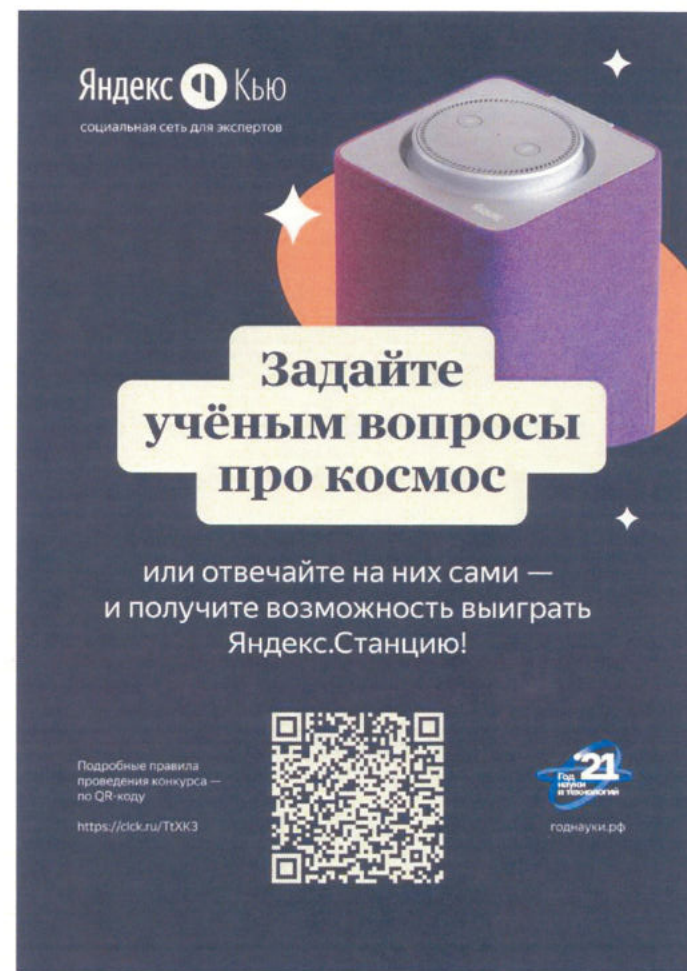
Афиша проекта (апрель)

В конце каждого месяца с победителями связываются представители сервиса для направления подарочных сертификатов.