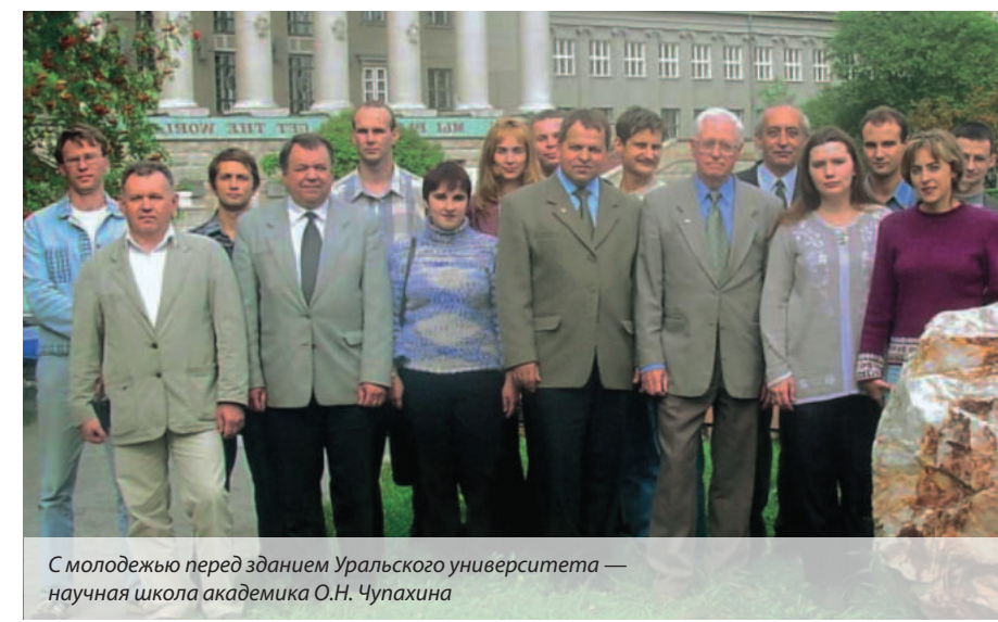
С молодежью перед зданием Уральского университета — научная школа академика О.Н. Чупахина