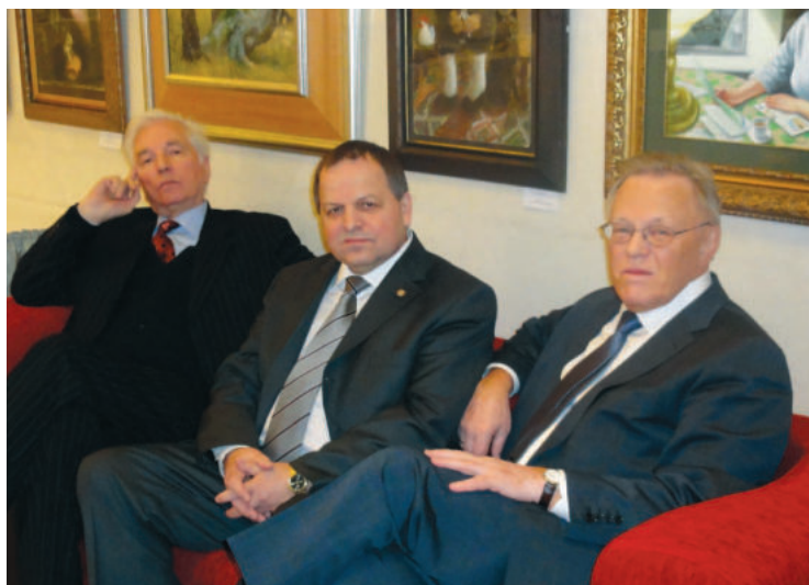
С президентом РАН Ю.С. Осиповым и вице-президентом РАН Г.А. Месяцем перед церемонией вручения Демидовских премий