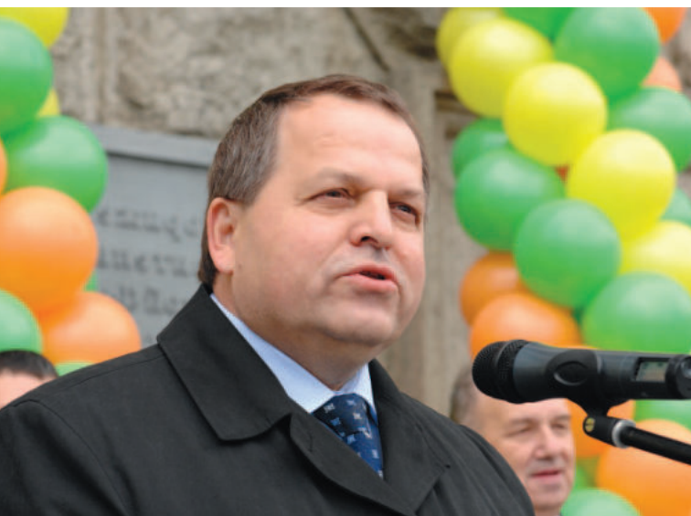
Приветствие студентов УрФУ в День знаний, 1 сентября 2010 г.