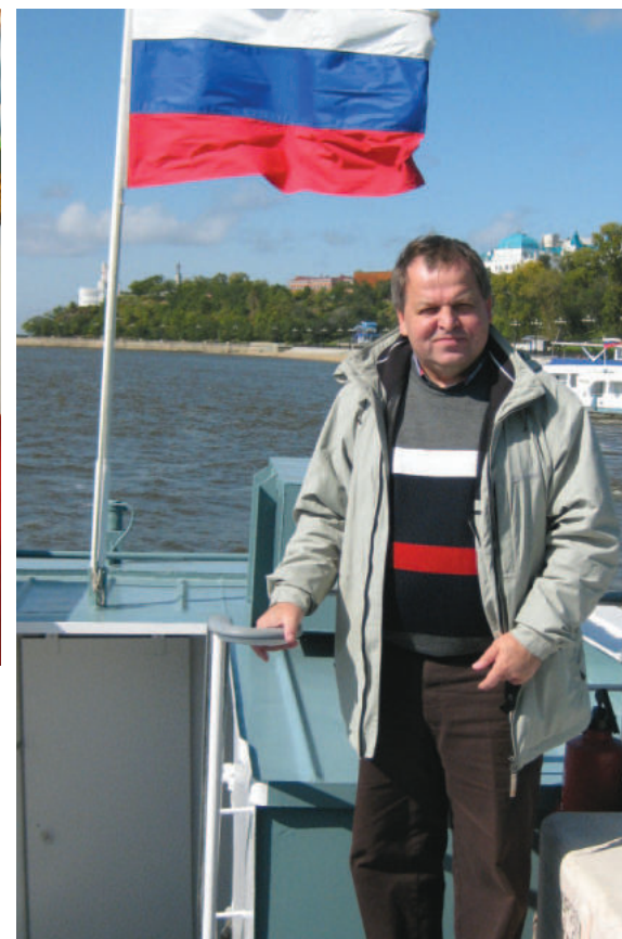
Посещение Хабаровского научного центра (на Амуре)