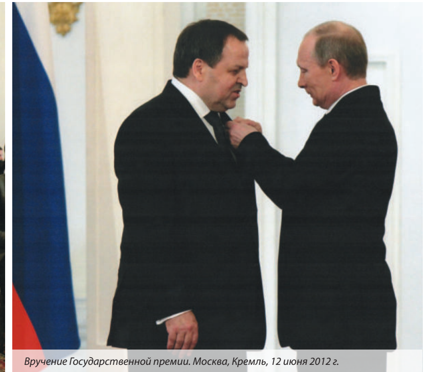
Вручение Государственной премии. Москва, Кремль, 12 июня 2012 г.

исследования по магнитной гидродинамике имеют огромное значение в практике. Ну, например, те же насосы для перемешивания жидких металлов, таких как натрий, скандий, которые используются в атомной промышленности. Производство редкоземельных металлов имеет ряд особенностей, и всевозможные магнитные перемешиватели — это результат фундаментальных исследований. В общем, приложения магнитодинамики распространяются от жидких металлов до галактик. И в докладе Фрика это было продемонстрировано весьма убедительно.