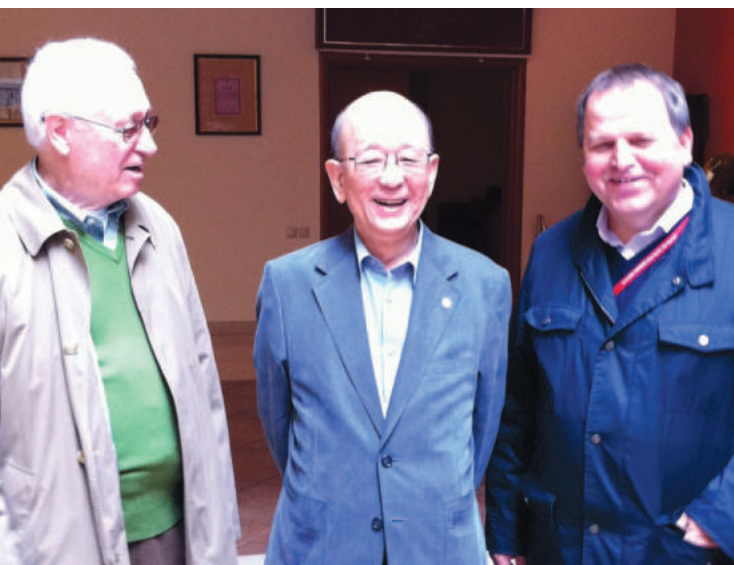
С лауреатом Нобелевской премии профессором Сузуки и академиком О.Н. Чупахиным, Казань, 2011 г.