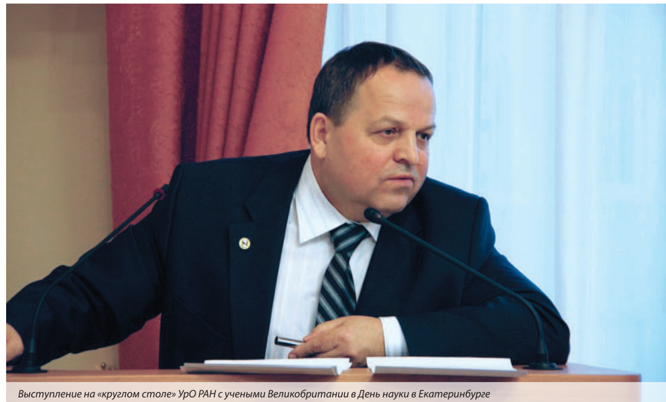
Выступление на «круглом столе» УРО РАН с учеными Великобритании в День науки в Екатеринбурге

— В определенной степени — да! Если по каким-то причинам поставки с Урала прекратятся, то треть мирового рынка авиации обрушится. Точно так же если наши атомграды введут эмбарго на ядерное топливо, то атомным станциям в США придется весьма туго. На Урале оказались предприятия, которые имеют огромное значение для развития экономики страны и мира, и это объективная реальность. А потому у нас десятки партнеров в разных точках планеты, и они заинтересованы в сотрудничестве. Это очень важно для развития науки на Урале.